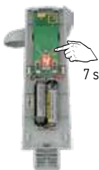
Druk op PROG toets tot...