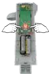
Druk op de + of - toets om de windwaarde in te stellen.

Zie de hieronder welke windkracht/snelheid bij welke windwaarde hoort.